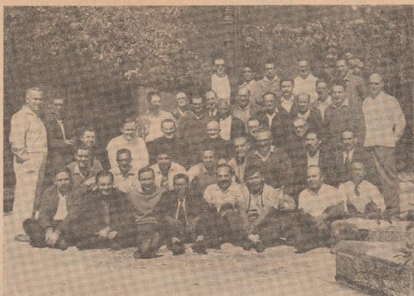
Primer Cursillo de Cristiandad en Guatemala

Eso mismo ha hecho que cursillos llegue a muchos rincones de Guatemala, en esta y las próximas ediciones del boletín conoceremos la Historia de cómo llegó Cursillos de Cristiandad a cada Comarca y Zona en la Arquidiócesis de Santiago de Guatemala .