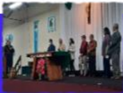
Secretariado Arquidiocesano 2023