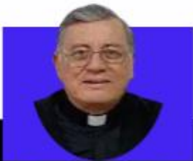
Mensaje de nuestro Asesor Espiritual