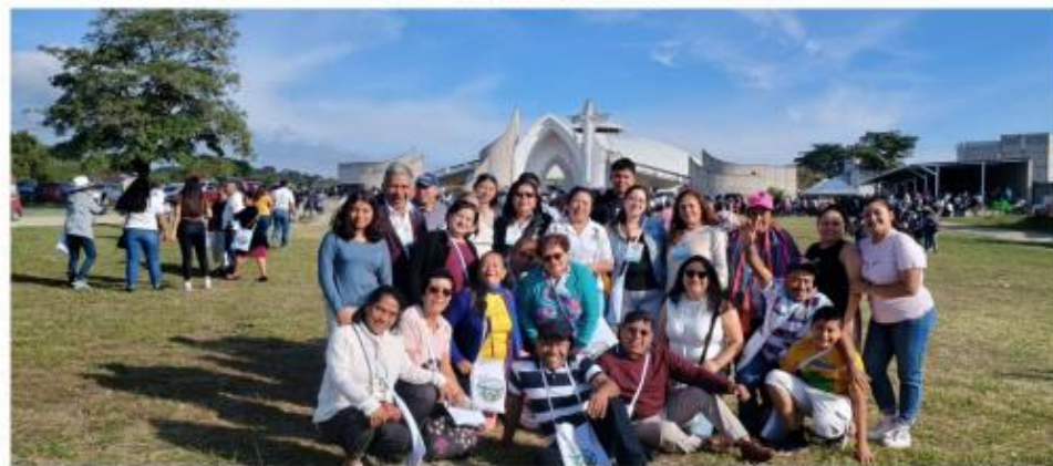
24 de noviembre, asistencia a la ultray regional.

"Aquí estoy Señor para hacer tu voluntad"