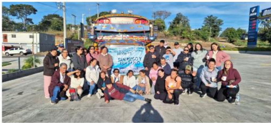
23 de noviembre asistencia a la tarde Marianas.